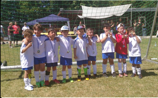
Foto: Die Fußballer des Turniers

Die neue DJK G-Jugendmannschaft hatte ihr erstes Turnier. Obwohl sie bisher nur fünfmal trainiert hatten, machten sich