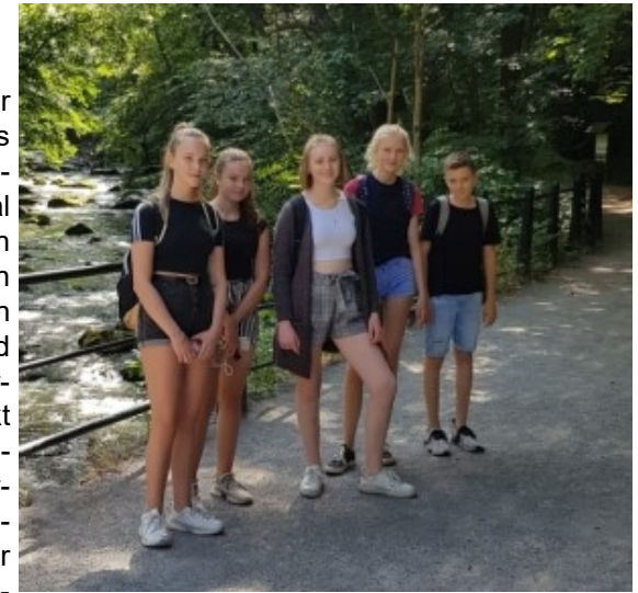
Foto: Die Teens am Hexentanzplatz

Auch dieses Jahr veranstaltete der DJK Dom Minden e.V ein besonderes Ferienprogramm für Teenager im Alter von 12 bis 16 Jahren. Dieses Mal ging es für fünf Tage in den Harz nach Thale. Am Montag wurde aus Minden Richtung Thale gestartet. Hier wurden dann direkt die Zimmer bezogen und die Herberge sowie das Umland erkundet. Am ersten Tag ging es direkt mit einer Gondelbahn zum sagenumwobenen Hexentanzplatz. Dieser wurde ausgiebig erkundet und nach Hexen Ausschau gehalten. Highlight war am auch die Fahrt auf der Bob-