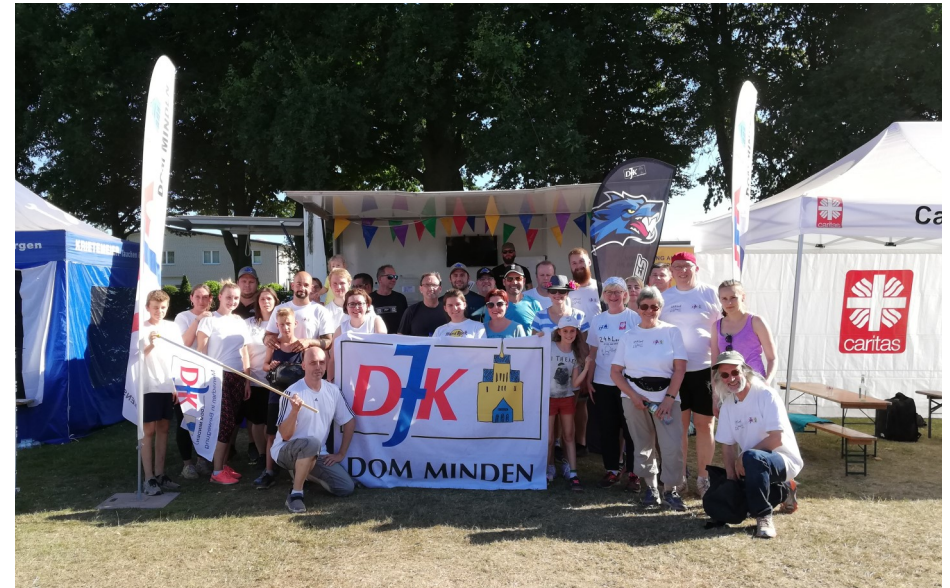
Foto: Die Läufer beim 24h- Lauf

und Laufbegeisterte. Unter anderem liefen die Mindener Wolves mit einer Nachtschicht auch beim Lauf mit. Insgesamt wurden in den 24 Stunden 800 Runden gemeinsam erlaufen. Im gesamt Ergebnis erzielte die DJK Dom Minden somit einen 9. Platz und ist somit sehr zufrieden mit den erlaufen Runden. Alle teilnehmenden Mannschaften sind mächtig stolz, denn sie haben zusammen 25.232 Runden geschafft. Die Spendenempfänger sind die fünf Mindener Jugendhäuser, der Deutsche Kinderschutzbund Ortsverband Minden-Bad Oeynhausens und die Fachberatungsstellen „Wildwasser“ und „mannigfaltig“. Fotos stehen im Internet.