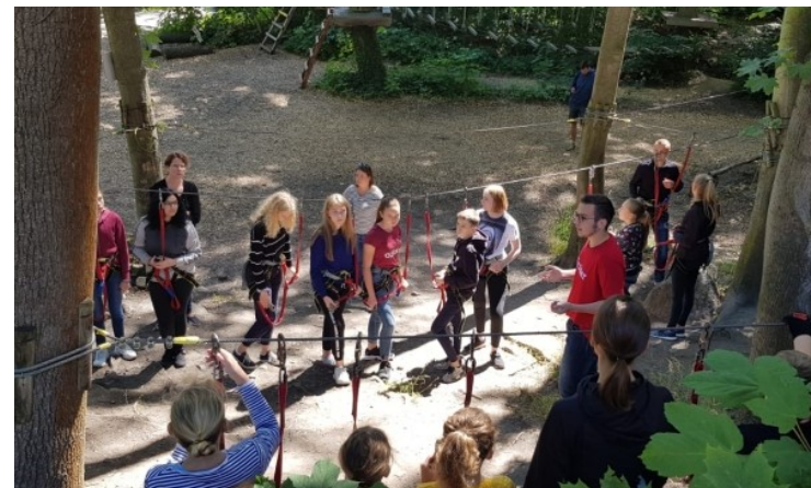
Foto: Die Teens beim Klettern

Besuch des Schwimmbades verbrachten die Jugendlichen fast den ganzen Tag mit Rutschen und Auspowern. Mit verschiedenen Spielen ging die Zeit im Schwimmbad viel zu schnell um. Am Freitag hieß es, bevor wieder Koffer gepackt wurden und ab nach Hause ging, noch einmal mit den Sessellift rauf den Berg. Trotz des Regens hat sich die Aussicht gelohnt. Abgerundet wurden die einzelnen Tage mit dem abendlichen gemütlichen Beisammen sein und Karten spielen. Nach fünf Tagen voller Spaß gingen die Teensferien zu Ende. Sowohl Jugendliche als auch Begleiter waren sehr zufrieden mit der Freizeit. Die Fotos stehen im Internet online unter www.djk-dom-minden.de .