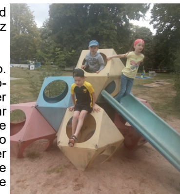
Foto: Ferienspielkinder auf dem Spielplatz

Am Samstagmorgen waren die Eltern zum gemeinsamen Frühstück ins Haus am Dom eingeladen. Hier erzählten alle Kinder aufgeregt und begeistert von den Erlebnissen aus der vergangenen Woche. Freudestrahlend und doch mit manch traurigen Gesichtern, dass die Woche bereits vorbei ist, verabschiedeten sich Kinder und Eltern von den Betreuern. Die Fotos stehen online unter www.djk-dom-minden.de