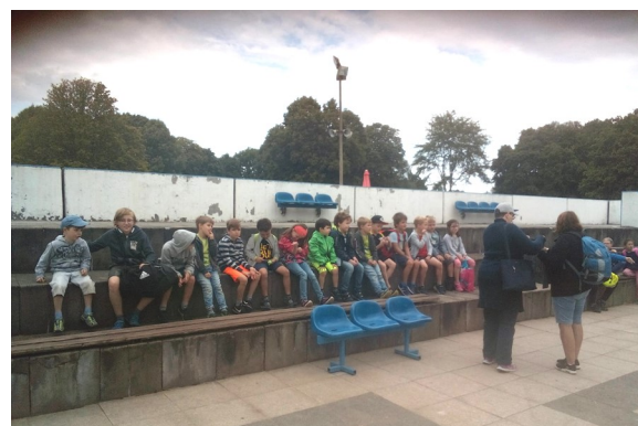
Foto: Ferienspielkinder im Sommerbad