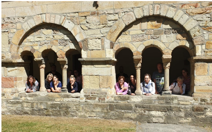
Foto: Teilnehmer der Klausurtagung

Doch wer viel arbeitet braucht auch eine bisschen Freizeit! Nach einer Führung durch den beeindruckenden Osnabrücker Dom und der Domschatzkammer konn-