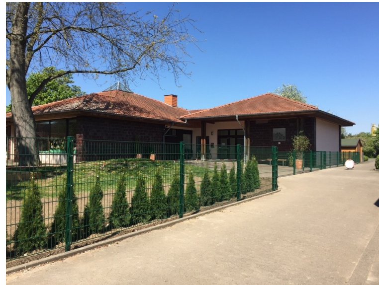
Foto: Das Kita Gebäude mit dem neuem Zaun

wurden Lebensbäume gesetzt. Diese werden nicht nur als schöner Sichtschutz dienen, sondern geben auch ein gemütliches Ambiente. Damit der Zaun zum Rest der Außenanlage und des Kindergartens passt, wurde auch noch der marode Hügel mit Erde aufgefüllt und neu begrünt. Der Hügel ist für die Kinder ein kleiner Abenteuerbereich, welcher zum Klettern und Spielen auffordert. Hinzu kam noch eine neue Sandkastenumrandung, die den Sand im Sandkasten lässt und den Kindern eine Balancierstrecke bietet. Zusätzlich wurden im hinteren Bereich des Kindergartens dringende Sanierungen vorgenommen. Dort befindet sich die U3- Gruppe, für die nun die Außen-