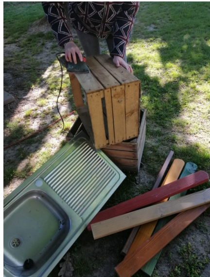
Foto: Die Erzieherinnen bei der Arbeit

Aber es tut sich was. Um das Spielen im Freien noch spannender und schöner zu gestalten, haben sich die Kollegen etwas Tolles überlegt: die Erzieherinnen bauen aus gespendeten Materialien eine Matschküche für das Außengelände der