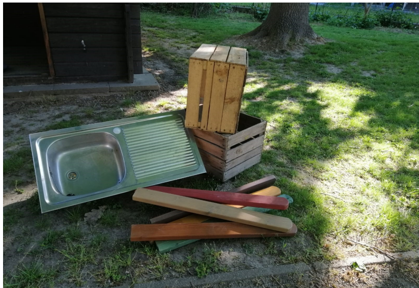
Foto: Die gespendeten Materialien