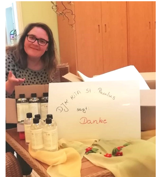
Foto: Die gespendeten Desinfektionsflaschen

Das angemeldete Kind konnte dann leider aus familiären Gründen doch nicht in die Kita kommen, somit verschob sich der Beginn der Notgruppe nach hinten und es sollte nicht bei dem einen Kind bleiben. Seitdem ändert sich die Betreuungssituation fast täglich und es gibt immer wieder neue Vorgaben der Landesregierung. Aufgrund dieser Ereignisse stellen auch unsere Mitarbeiter jeden Tag ihre Flexibilität und ein hohes Maß an Engagement unter Beweis. Denn auch diese haben ihre Kinder in Notgruppen angemeldet.