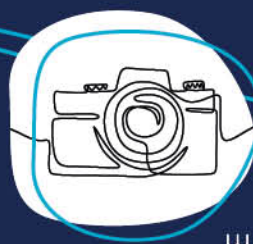
FOTO & FILM